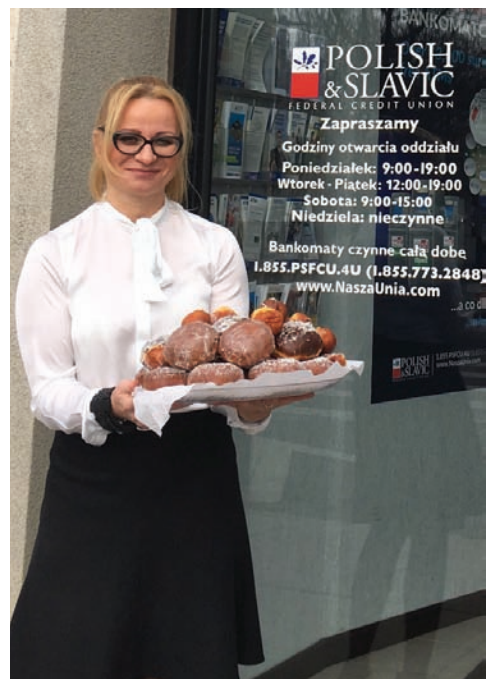
Słodkie zaproszenie do oddziału w Ridgewood

Jak co roku w Łusty Czwartek w oddziałach Polsko-Słowiańskiej Federalnej Unii Kredytowej stało się zadość tradycji jedzenia pączków. Członkowie Naszej Unii zjedli ich