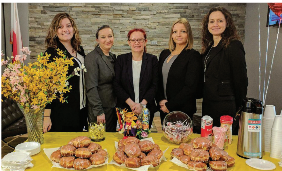
Pyszne pączki w oddziale PSFCU w Schaumburgu

w tym dniu ponad cztery tysiące. Można powiedzieć, że pączki w 17 oddziałach Naszej Unii w Łusty Czwartek to już tradycja. Od kilku lat na Członków Naszej Unii odwie-