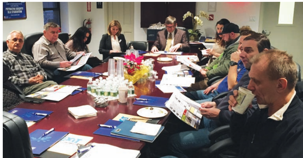
Pracownicy PSFCU przedstawiają ofertę pożyczkową Naszej Unii