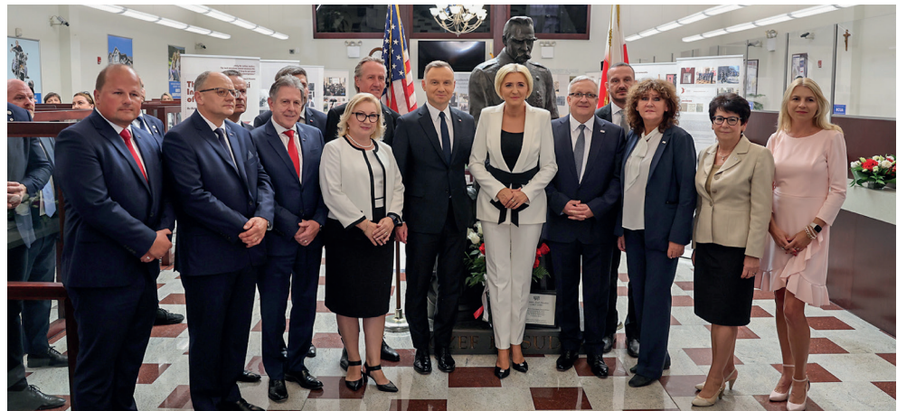
Pamiątkowe zdjęcie podczas spotkania z Parą Prezydencką w oddziale PSFCU przy 140 Greenpoint Avenue