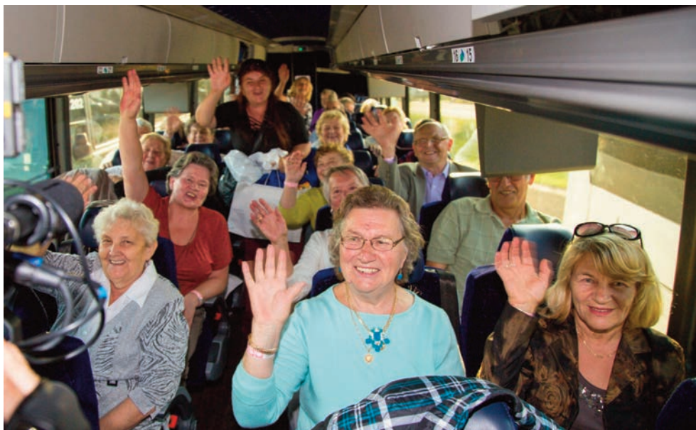
Polonijni seniorzy z Clifton, NJ podczas pielgrzymi do Amerykańskiej Częstochowy zorganizowanej przez Naszą Unię

Wallington, NJ 07057). Po jednym autobusie podstawimy pod oddziałami w Copiague (314 Great Neck Road, Copiague, NY 11726), Maspeth (66-14 Grand Avenue, Maspeth, NY 11378), Ridgewood (69-03 Fresh Pound Road, Ridgewood, NY 11385), Clifton (990 Clifton Avenue, Clifton, NJ 07013), Linden (619 West Edgar Road, Linden, NJ 07036) i Union (667 Chestnut Street, Union, NJ 07083).