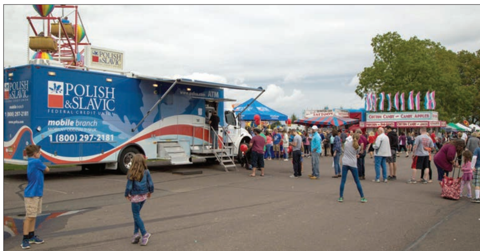
Oddział Mobilny i namiot PSFCU podczas Festiwalu Polskiego w Amerykańskiej Częstochowie

Już po raz szósty Polsko-Słowiańska Federalna Unia Kredytowa organizuje dla seniorów Naszej Unii z Nowego Jorku i New Jersey bezpłatny wyjazd do sanktuarium Matki Bożej Częstochowskiej w Doylestown w Pensylwanii. Aby pojechać do popularnej Amerykańskiej Częstochowy w Labor Day należy zapisać się w jednym z oddziałów PSFCU na Wschodnim Wybrzeżu.