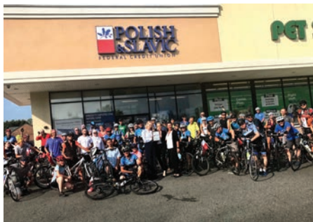
Uczestnicy pielgrzymki rowerowej pod oddziałem PSFCU w Wallington, NJ

Po drastycznych ograniczeniach spowodowanych pandemią COVID-19, powoli wraca aktywność w polonijnej społeczności. W dniach 17-19 lipca br.