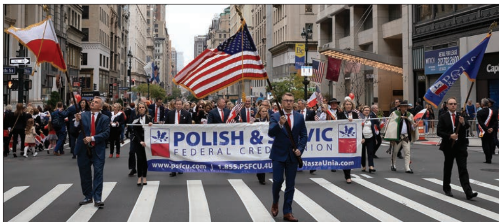
Kontyngent PSFCU na Piątej Alei na nowojorskim Manhattanie podczas ubiegłorocznej Parady Pułaskiego